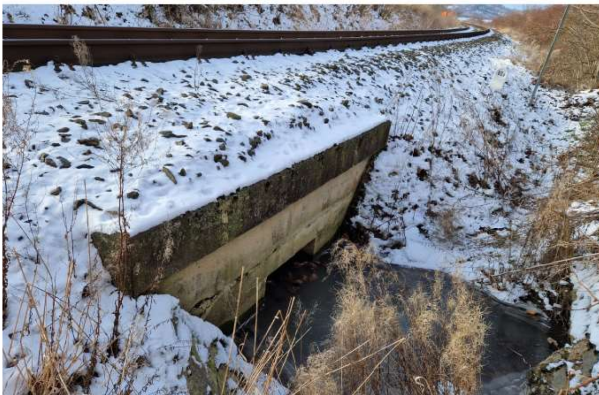
Pohled na výtok