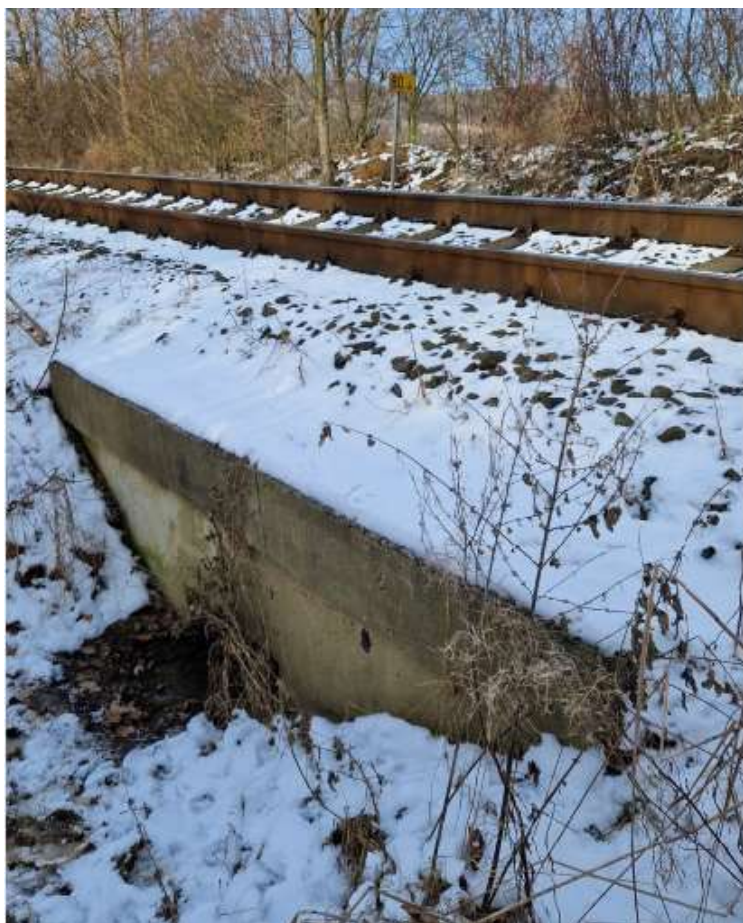
Pohled na vtok